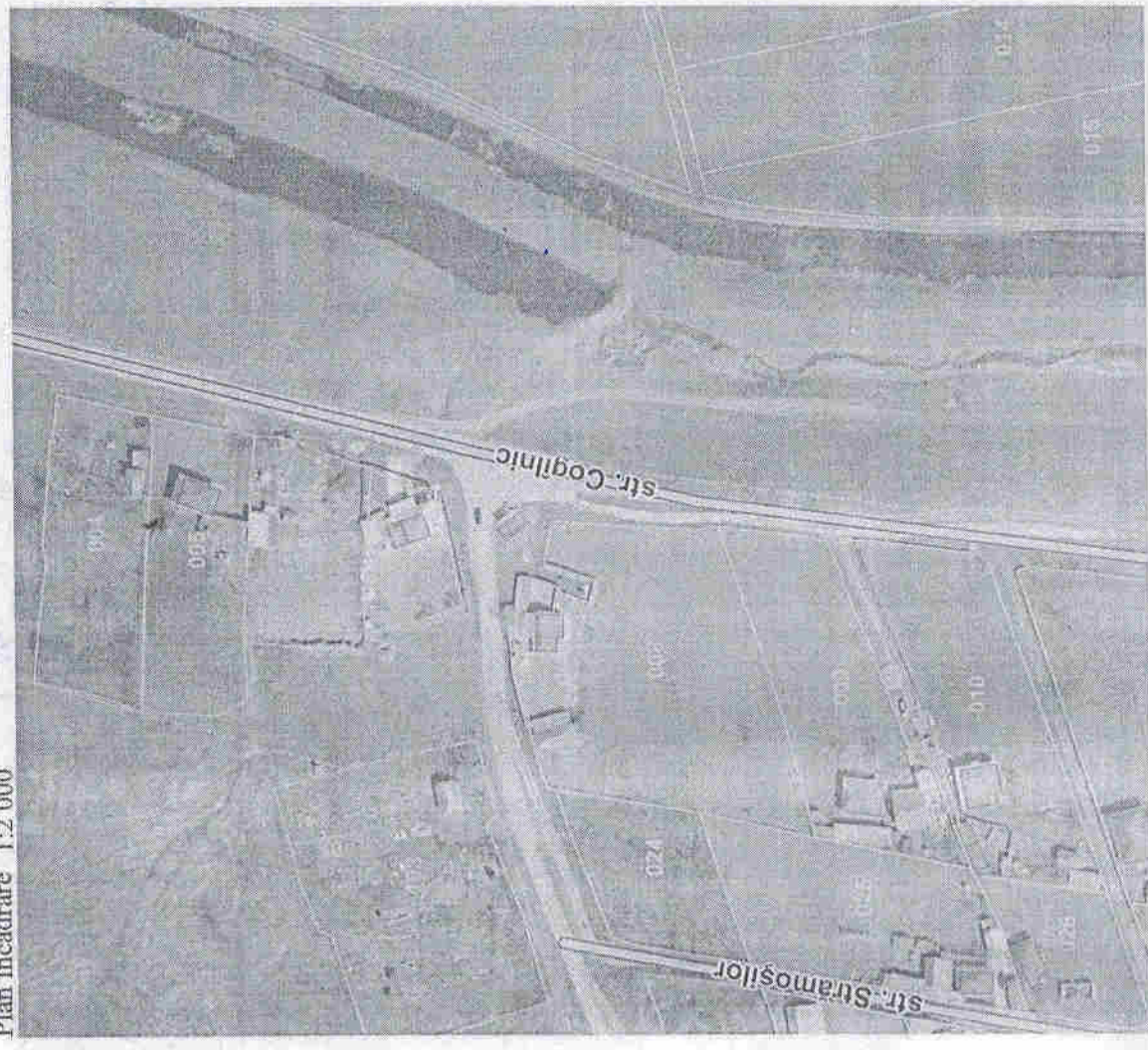
Plan încadrare 1:2.000